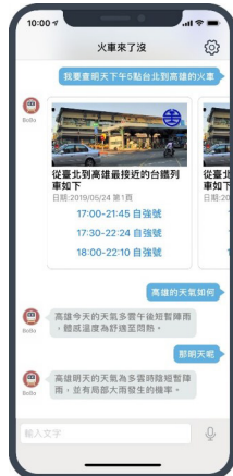
火車來了沒小幫手